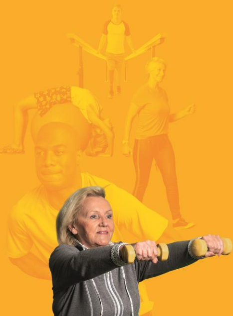
Arm-, hand- en schouderklachten en problemen bij dagelijkse activiteiten

Revalidanten geven hun behandeling gemiddeld het cijfer 8,8