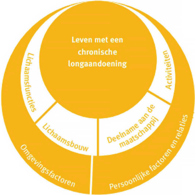
Figuur 1: ICF-model International Classification of Functioning: het model van het menselijk functioneren ontwikkeld door WHO World Health Organization